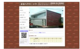
ホームページ画面

クリニック内の様子(写真)や検査機器の紹介など当院に関係のある内容を掲載しております。お時間がある時、ご覧ください。 http://www.manabeclinic.jp